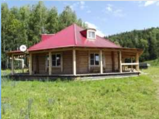
База отдыха Аксаур