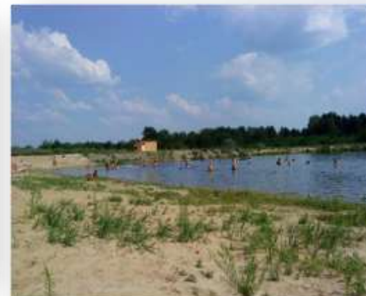
База отдыха Надежда