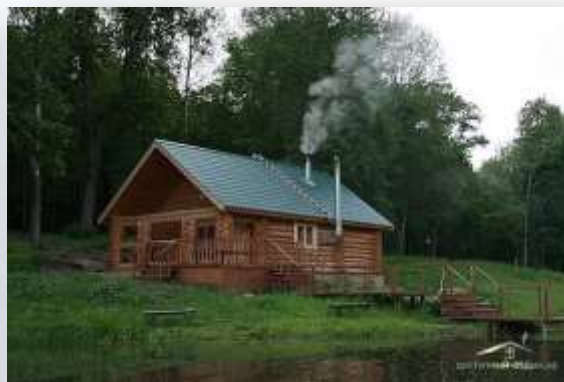
База отдыха Налитово